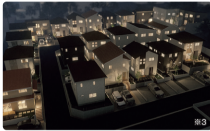
※1~3 本画像はイメージにつき、風景・建物・植栽につきましては施工後の現物との差異が生じます。つきましては本画像によって生じたいかなる損害については一切責任を負いません。